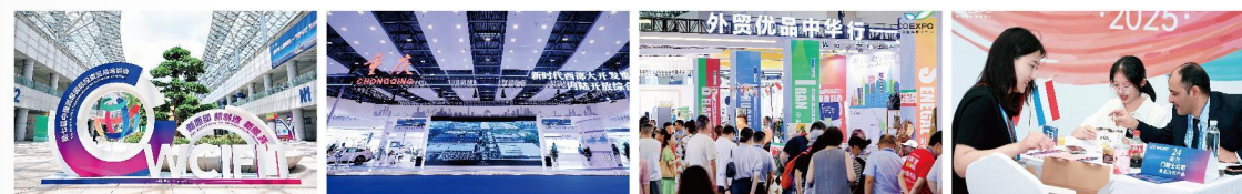
中国汽车、摩托车品牌出海非洲采供资源对接会

第七届西洽会于2025年5月22日-25日在重庆国际博览中心圆满举办，立足西部、面向全球，突出新时代新西部大背景，聚焦推动现代生产性服务业发展，广大政商企业汇聚重庆，开展商务洽谈、展览展示、经贸对接、招商引资等活动。