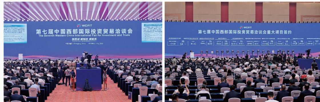
第七届中国西部国际投资贸易洽谈会开幕