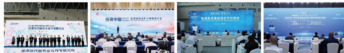
渝港现代服务业合作专题活动